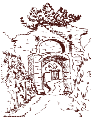
La Porte du Fort