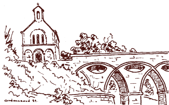
Chapelle et Pont Saint-Léger