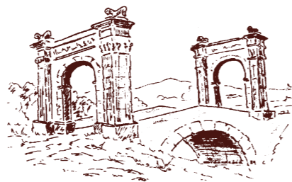
Le Pont Flavien

Saint Chamas est aujourd'hui un gros bourg qui essaie de se moderniser (port de plaisance, nouveaux quartiers). Fier de ses vestiges dont le Pont Flavien reste le plus illustre, il a su conserver tout le cachet des villages provençaux.