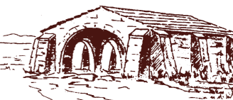
Lavoir du Polygone

Elle surplombe l'Etang et le village et fut célèbre pour ses ex-votos. Certaines de ces peintures naïves ont été restaurées et sont aujourd'hui au musée.