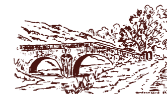
Le Pont de la Roquette

ERMITAGE SAINT LÉGER : Il existait déjà au XVI e siècle. Les notables du village s'y faisaient ensevelir. Détruit en 1845 à cause de la construction du viaduc, il fut reconstruit à l'emplacement actuel. Centre de pèlerinage et de dévotion des habitants, la chapelle a été abandonnée depuis quelques dizaines d'années.