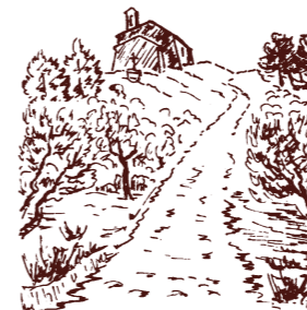
Notre Dame de Miséricorde